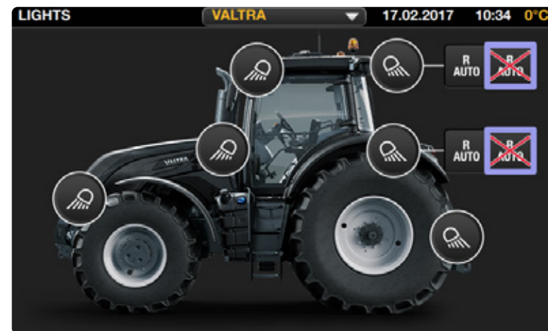
Configuración sencilla de las luces de trabajo desde la terminal. Interruptor de encendido / apagado de luces de trabajo en el apoyabrazos con interruptor de encendido / apagado de balizas.