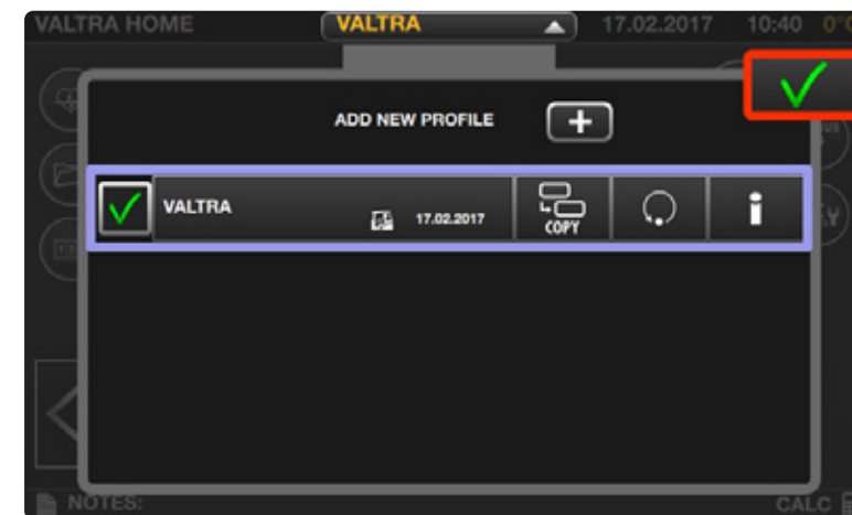
Posibilidad de guardar perfiles para operadores e implementos que se pueden cambiar fácilmente desde cualquier menú de pantalla.