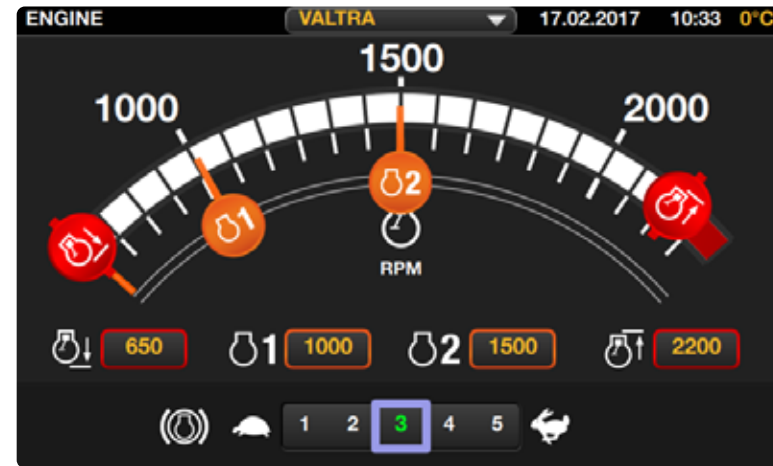
Configuración lógica con gestos de deslizamiento. Todos los ajustes se almacenan automáticamente en la memoria.