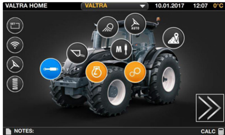
Menú muy fácil de navegar.