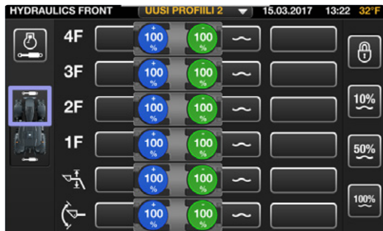
Desde cualquier control, usted puede controlar cualquier servicio hidráulico, incluidas las válvulas hidráulicas (delantera y trasera), el tercer punto (frontal y trasero).